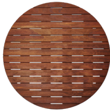
Kebony öljytty/oiled/oljad/ oljebehandlet/ ölitatud