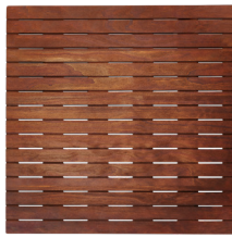
Kebony öljytty/oiled/oljad/ oljebehandlet/ ölitatud